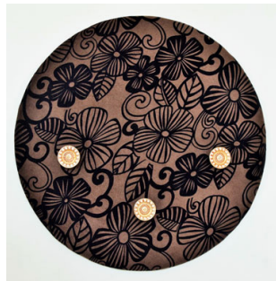
CODE 007 (d = 450 mm)