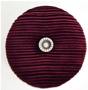
CODE 006 (d = 260 mm)