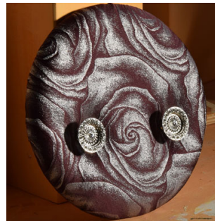
CODE 004 (d = 290 mm)