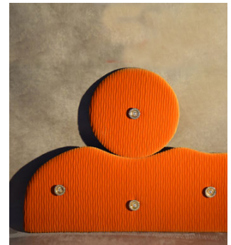
CODE 009 (900 x 590)