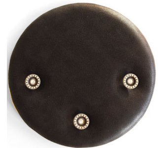
CODE 004 (d = 460 mm)