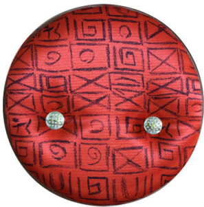
CODE 002 (d = 290 mm)