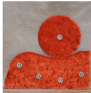
CODE 008 (800 x 620 mm)